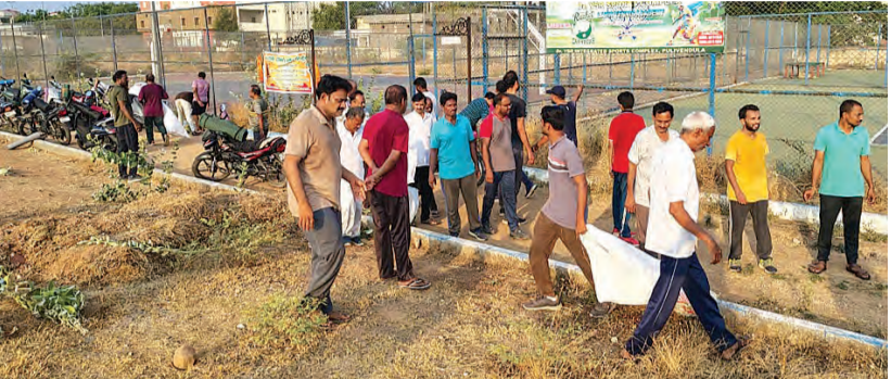
మైదానంలో తూగుట్ల మధు ఆధ్వర్యంలో చెత్తను సేకరిస్తున్న సరైజ్ యోగి గ్రూప్ సభ్యులు