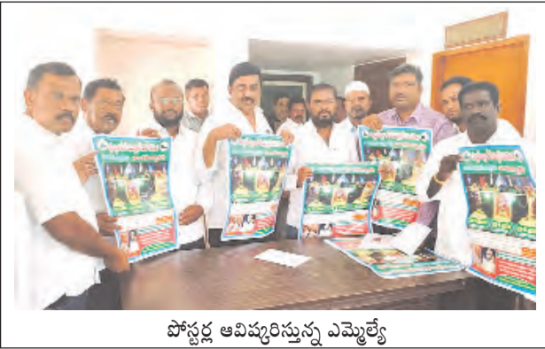
పోస్టల్ ఆవిష్కరణస్థుని ఎమ్మెల్యే