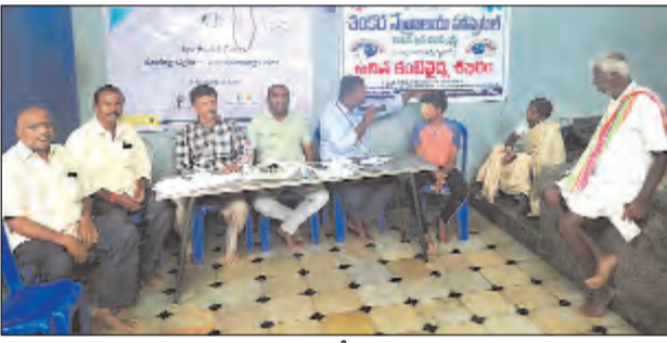
రామసముద్రం మే 17 ప్రభాతవార్త