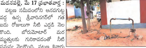
మదనపల్లె, మే 17 ప్రభాతవార్త

పట్టణ సమీపంలోని అనగరట్ల వద్ద ఉన్న శ్రీవారి నగర్లో గత ఐదు రోజులుగా నీటి ఎద్దడి నెలకొంది. బోరుమోటార్ మరమ్మత్తులకు గురికావడంతో నీటి సమస్య నెలకొంది.