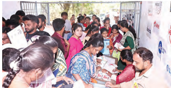
జాబ్ మేళాకు తరలివచ్చిన నిరుద్యోగులు

తున్నాయని,వాటిలో పాటు వివిధ కంపెనీలకు సంబంధించి జాబ్ మేళాలు నిర్వహించి ఈ జాబ్ మేళాలో అర్హత పొందిన నిరుద్యోగులకు ఉద్యోగాలు కల్పించడం తమకు చాలా ఆనందంగా ఉందని ఆయన తెలియజేశారు. రాజంపేట నియోజకవర్గంలో వారంలో ఏడు రోజులు ప్రజల కోసమే పని చేస్తామని, ప్రజలకు అనారోగ్య సమస్యలు తొలగించేందుకు ప్రత్యేక వైద్య శిబిరాలతో పాటు,నిరుద్యోగులకు ఉద్యోగ అవకాశాలు కల్పించేందుకు కంపెనీలతో జాబ్ మేళాలు వరుసగా నిర్వహిస్తామని ఆయన తెలియజేశారు. ప్రతి ఇంట్లో ఒక మహిళా పా