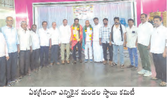
ఏకగ్రీవంగా ఎన్నికైన మండల స్థాయి కమిటీ

పీలేరు పట్టణంలోని ఎస్సీఎస్ఎస్ కళ్యాణ మండలంలో ఆదివారం పీలేరు మండల కురుబకుల సంఘం మండల స్థాయి కమిటీ ఏర్పాటు సమావేశం ఘనంగా నిర్వహించబడింది.