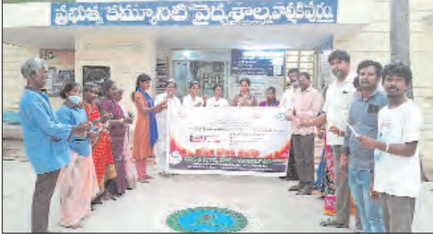
వాల్మీకిపురం, మే 17 ప్రభాతవార్త

స్థానిక ప్రభుత్వానుసరించి ఆదివారం అంతర్జాతీయ ఎయిడ్స్ కొవ్వొత్తుల ర్యాలీ దినోత్సవాన్ని ఐసీటీసీ కేంద్రం ఆధ్వర్యంలో నిర్వహించారు.